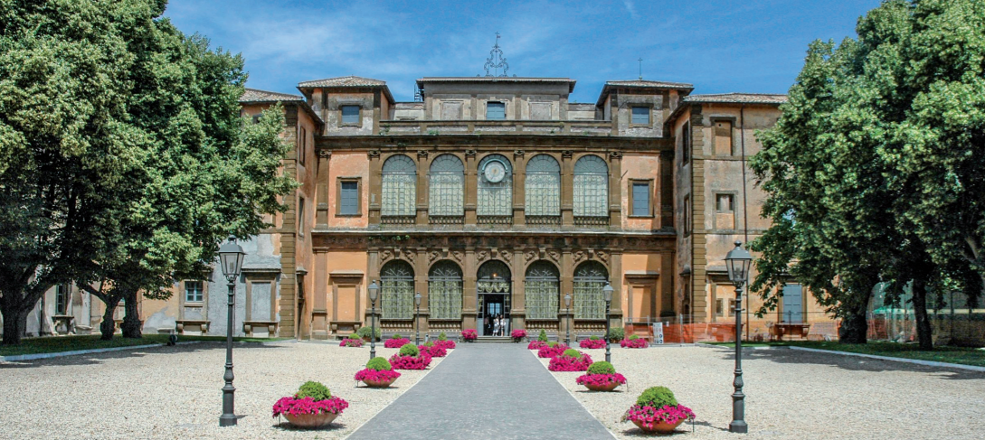
Villa Mondragone - Centro Congressi Università di Roma Tor Vergata